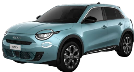
Blau - Sky of Italy