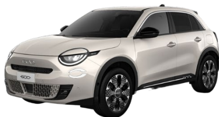
Sand - Earth of Italy