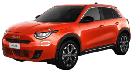
Orange - Sun of Italy