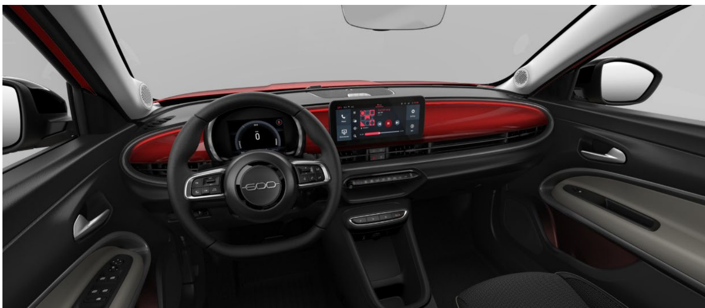
Armaturenbretteinlage in Wagenfarbe lackiert