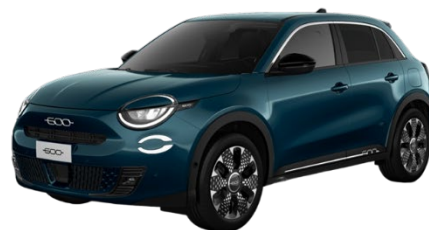
Grün - Sea of Italy