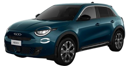
Grün - Sea of Italy