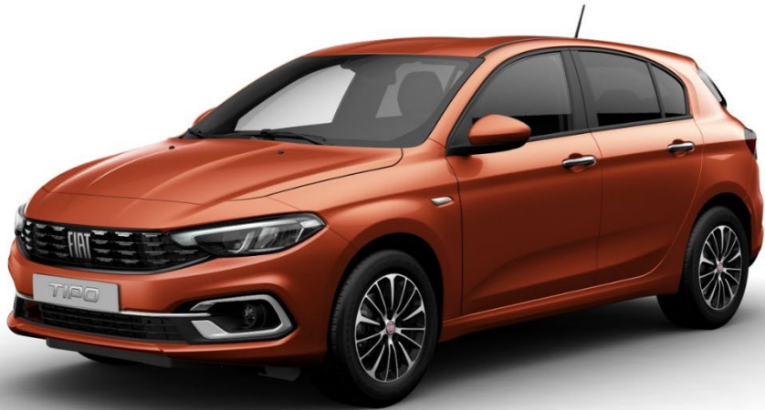
SWISS EDITION CROSS