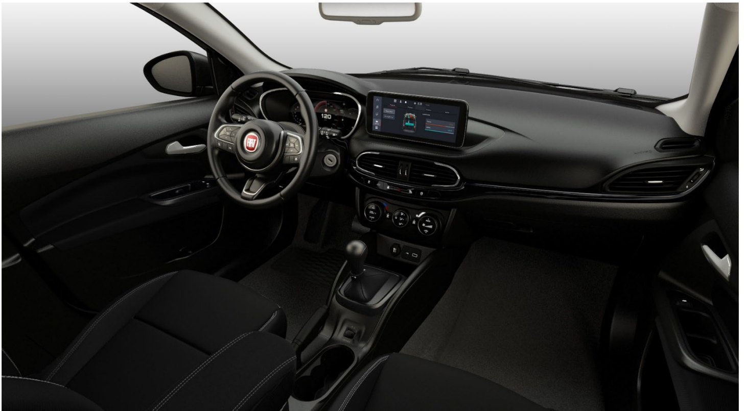
SWISS EDITION CROSS