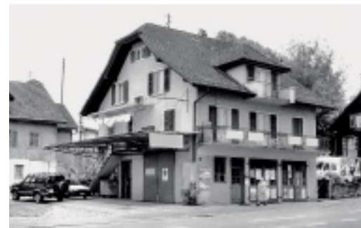
Die ehemalige Sonnenplatz-Garage.

Das führende Unternehmen der Automobilbranche beschäftigt heute über 80 Mitarbeitende und bildet in ver-