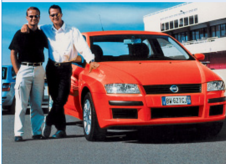
Der Fiat Stilo Michael Schumacher: immer eine Nasenlänge voraus

Den Stilo Schumacher – mit Logo an den Seitenschwellen und am Kofferraum – gibts ausschliesslich in der Farbe Rosso Corsa und mit drei Türen. Er ist erhältlich ab 33 990 Franken netto (inkl. MWSt.) mit einem 2.4-20V-/170-PS-Benzinmotor. Für 34 390 Franken netto (inkl. MWSt.) ist das Sondermodell auch mit dem 1.9-Multijet-Diesel mit 140 PS zu haben. Das serienmässig reich ausgestattete Sondermodell bietet viele Extras und hohen Komfort. Gegenüber den Standardversionen profitieren Schumi-Fans von einem Preisvorteil bis zu 3203 Franken.