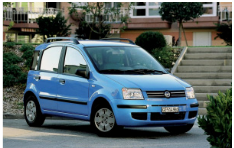
Fiat Panda begeistert bei Arbeit und Freizeit.

dermer 1.3-JTD-Multijet mit 70 PS zur Verfügung. Den Panda Van gibts bereits ab 13 250 Franken (inkl. MWSt.). In Kürze wird der beliebte Fiat Panda 4x4 1.3-16V-Multijet-Diesel auf allen Pisten gross in Fahrt kommen. Dieser kompakte, technologisch ausgereifte Multijet in Miniatur-Bauweise ist leistungsfähig und langlebig zugleich. Ausgelegt für eine Lebensdauer von 250 000 km, ist innerhalb dieses Zeitraums keine Wartung der mechanischen Komponenten erforderlich (selbst ein Riemenwechsel bei 80 000 km entfällt). Der direktein-spritzende Common-Rail-Dieselmotor der zweiten Generation steht für Umweltverträglichkeit nach Euro-Norm 4.