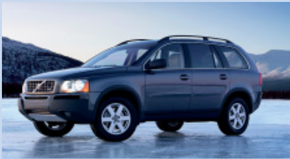
Treu auf der Spur mit dem Volvo XC90 V8