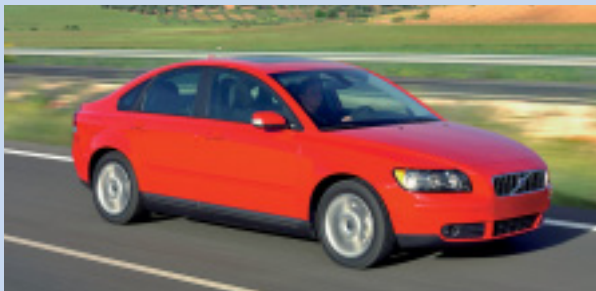
Volvo S40 – intelligenter Trendsetter

Wenn der schwedische Autohersteller die Jahresproduktion des XC90 von 50 000 auf 90 000 Stück erhöht, muss was dran sein. Oder drin. Und in der Tat machen ein völlig neuer Antrieb mit V8-Motor, 6-Gang-Automatik und dem neuesten AWD-System dieses clevere Auto attraktiver denn je. Der kompakte, quer eingebaute V8-Motor von Volvo erfüllt als erster V8-Benzinmotor die amerikanischen ULEV-II-Abgasvorschriften. Sein herausragender Sicherheitsstandard und die Umweltverträglichkeit sorgen für frischen Wind im V8-Markt, Fahrspass, Leistung und Motorsound inbegriffen. Die richtige Mischung aus SUV mit bis zu sieben Sitzen, hohem Sicherheitsstandard, dem Fahrverhalten eines Pkw und wettbewerbsfähigen Umwelteigenschaften macht den XC90 zu einem der beliebtesten Autos. Den XC 90 mit dem sagenhaften V8-Motor gibts ab April dieses Jahres.