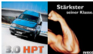
Kraft für zwei: der Iveco Daily mit neuem Motor.

Als Alternative für den HPT-Motor bietet sich der 3.0-HPI-Motor mit 136 PS und 340 Nm an. Beiden aber ist eines gemeinsam: Sie sind kraftvoll, durchzugsstark und bieten viel Spass beim Fahren auf der Autobahn und in den Bergen.