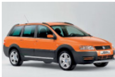
Fiat Uproad: der bullige Offroader für Freizeit und Abenteuer.

Schweizer Premiere feiert der Fiat Stilo Uproad am diesjährigen Genfer Automobilsalon. Auf Schweizer Strassen wird das komfortable Freizeitauto mit modernem, leistungstarkem 1.9-JTD-Common-Rail-Multijet-Diesel mit 140 PS ab Juni 2005 zu sehen sein. Eine reiche Sicherheitsausrüstung und vollständiger Komfort, sein spezielles Äusseres machen den Uproad zum eigentlichen Freizeit- und Abenteuerfahrzeug, das ab rund 34 000 Franken erhältlich sein wird.