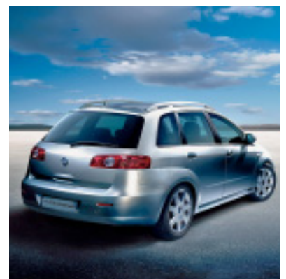
Wunschlos glücklich macht der neue Croma, das Flaggschiff von Fiat.

Am diesjährigen Autosalon in Genf stellt Fiat als Weltpremiere den neuen Croma vor. Er trägt die Handschrift von Giugiaro und besticht als klassische Stufenhecklimousine mit den Vorzügen eines Vans: riesiges Platzangebot, vielfältig variabel im Innenraum, hervorragende Rundumsicht, erhöhte Sitzposition, attraktives, sportlich-elegantes Design, optimale Fahreigenschaften mit temperamentvollen Motoren und hohem Komfort. Im September ist er mit einem 2.2-Liter/150-PS-Benzinmotor und drei Common-Rail-Diesellaggregaten der jüngsten Multijet-Generation in der Schweiz – und auch beim Hammer Auto Center erhältlich.