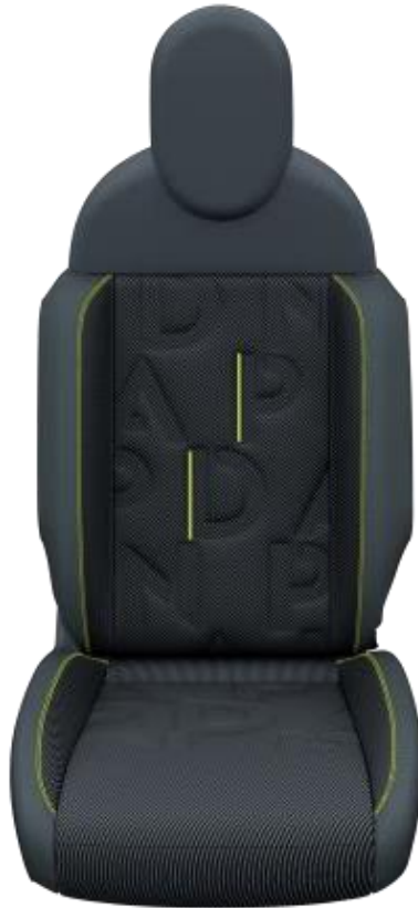
Sitze (RED) – blauer Stoff mit gelben Nähten und Panda-Logo.