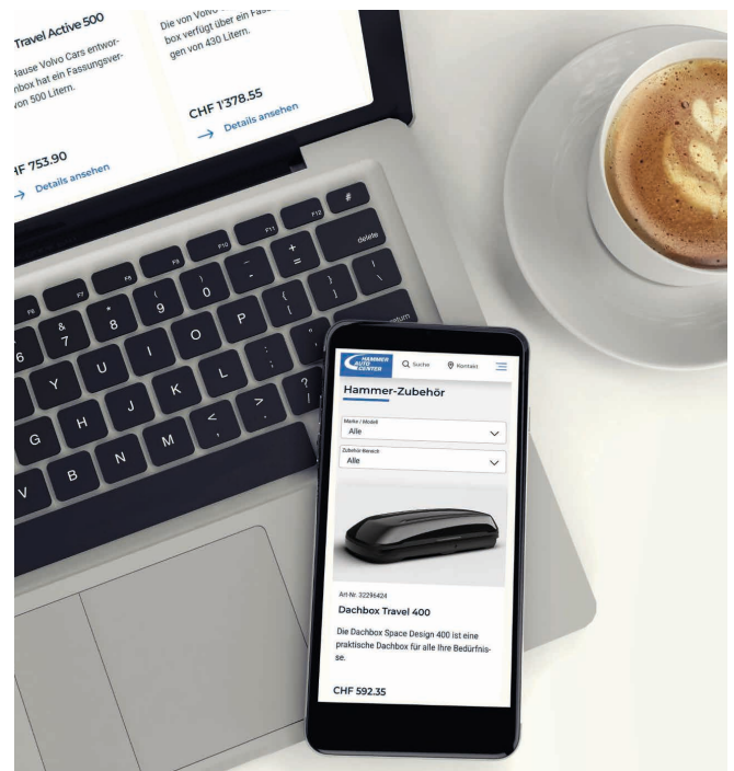
Unser neuester Service ist der Online Zubehör-Shop.

attraktiven Flottenkonditionen angefragt werden. Auf der erweiterten Jobseite können Bewerbungsunterlagen digital hochgeladen oder Kurzbewerbungen in einem sogenannten Jobquiz in wenigen Minuten ausgefüllt werden. Jüngstes Kind ist der Online-Shop im Zubehörbereich, in dem Artikel wie Anhängerkupplungen, Dachboxen, Innenraummatte und vieles mehr erworben werden können. All diese Bemühungen haben ein Ziel: Unsere Dienstleistungen sollen für unsere Kundschaft online wie offline so einfach wie möglich zugänglich sein und uns intern die Abläufe erleichtern. ■